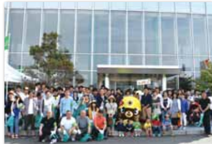
川渡り神幸祭清掃活動

創業以来常に皆様と共に、地域の暮らしに根ざした身近な金融機関として実績を重ねてまいりました私たちしんきんでは、常にふれあいを大切にして、お付き合いの和を広げていきたいと願います。毎年盛大に開催される「川渡り神幸祭」への積極的な取り組みを始め、「ふる里かわら夏まつり盆踊り大会」、「I LOVE フクチフェスタ」など様々な地域行事への参加などを通して、地域の一員としての連帯と交流を深めています。