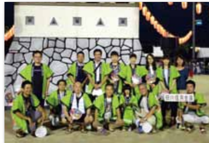
ふる里かわら夏まつり盆踊り大会