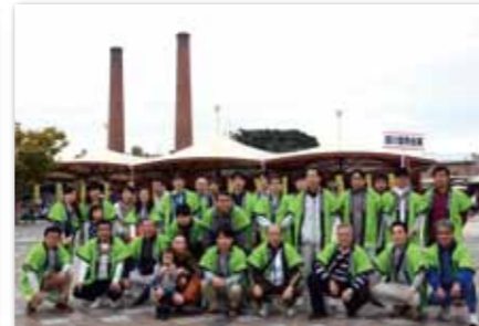
TAGAWAコールマイン・フェスティバル「炭坑節まつり」