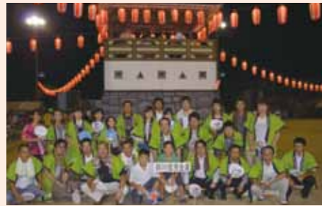
ふる里かわら夏まつり