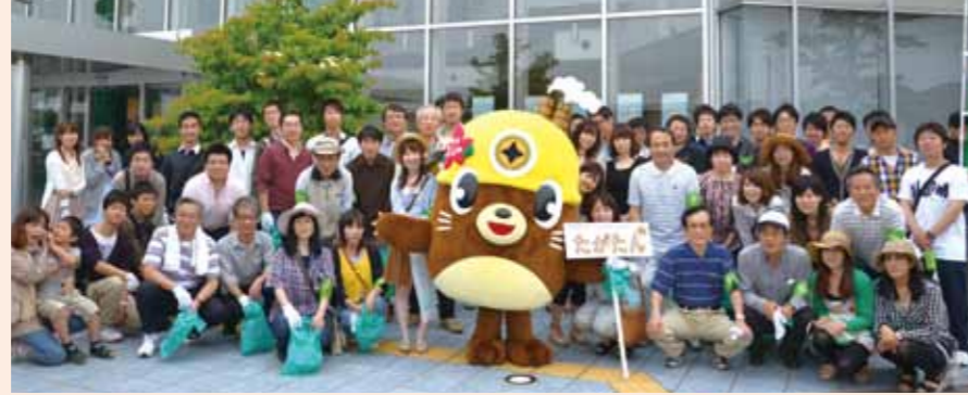
川渡り神幸祭清掃活動