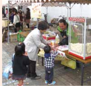
福岡県立大学秋興祭

創業以来常に皆様と共に、地域の暮らしに根ざした身近な金融機関として実績を重ねてまいりました私たちしんきんでは、常にふれあいを大切にして、お付き合いの和を広げていきたいと願います。毎年盛大に開催される「川渡り神幸祭」への積極的な取り組みを始め、「ふる里かわら夏まつり盆踊り大会」、「I LOVE フクチフェスタ」など様々な地域行事への参加などを通して、地域の一員としての連帯と交流を深めています。