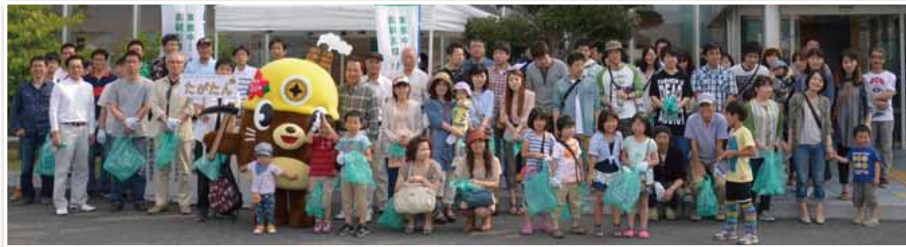
川渡り神幸祭清掃活動

創業以来常に皆様と共に、地域の暮らしに根ざした身近な金融機関として実績を重ねてまいりました私たちしんきんでは、常にふれあいを大切にして、お付き合いの和を広げていきたいと願います。毎年盛大に開催される「川渡り神幸祭」への積極的な取り組みを始め、「ふる里かわら夏まつり盆踊り大会」、「I LOVE フクチフェスタ」など様々な地域行事への参加などを通して、地域の一員としての連帯と交流を深めています。