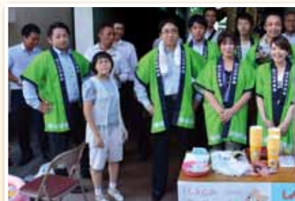
I LOVE フクチフェスタ