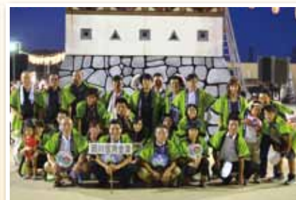
ふる里かわら夏まつり盆踊り大会