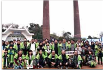
TAGAWA コールマイン・フェスティバル「炭坑節まつり」