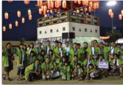
ふる里かわら夏まつり盆踊り大会