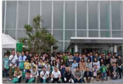
川渡り神幸祭清掃活動

創業以来常に皆様と共に、地域の暮らしに根ざした身近な金融機関として実績を重ねてまいりました私たちしんきんでは、常にふれあいを大切にして、お付き合いの和を広げていきたいと願います。毎年盛大に開催される「川渡り神幸祭」への積極的な取り組みを始め、「ふる里かわら夏まつり盆踊り大会」、「I LOVE フクチフェスタ」など様々な地域行事への参加などを通して、地域の一員としての連帯と交流を深めています。