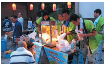
須佐神社夏祭り (香春町)