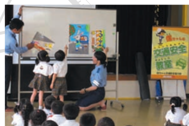
当金庫主催による幼稚園児の交通安全教室