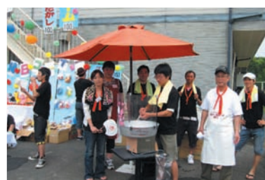
なんだかんだ祭 (刈田町)