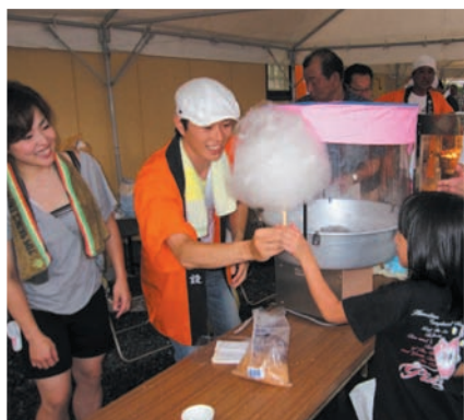
福祉施設祭り (田川市)