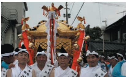
川渡り神幸祭 (田川市)

創業以来常に皆様と共に、地域の暮らしに根ざした身近な金融機関として実績を重ねてまいりました私たちしんきんでは、常にふれあいを大切にして、お付き合いの和を広げていきたいと願います。毎年盛大に開催される「川渡り神幸祭」への積極的な取り組みを始め、「ふる里かわら夏まつり盆踊り大会」、「I LOVE フクチフェスタ」、「そえだ夏まつり」など様々な地域行事への参加などを通して、地域の一員としての連帯と交流を深めています。