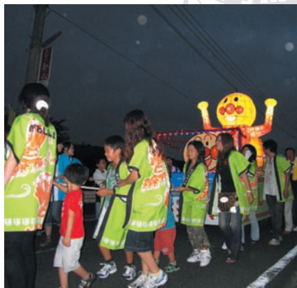
そえだ夏まつり (添田町)