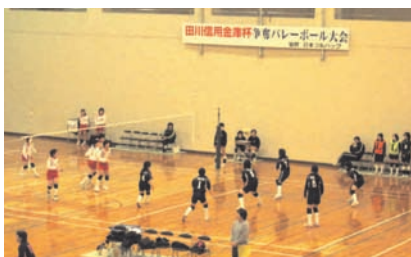
田川信用金庫杯バレーボール大会