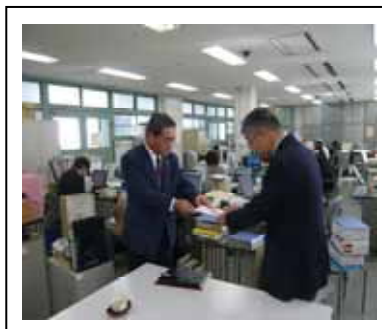
(社)佐賀県青少年育成県民会議