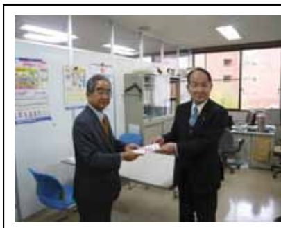
(社)福岡県青少年育成県民会議