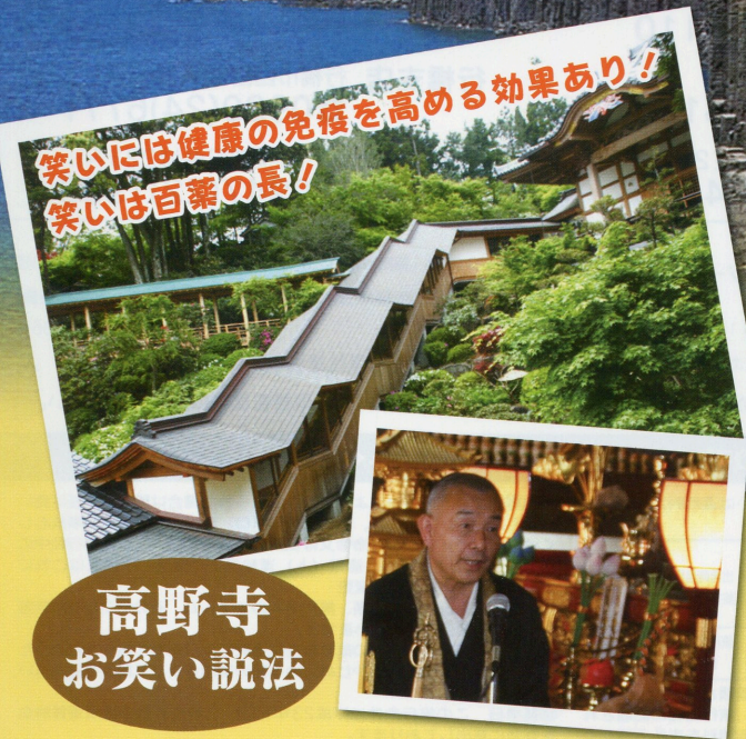
高野寺 お笑い説法