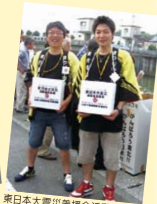
東日本大震災義援金活動