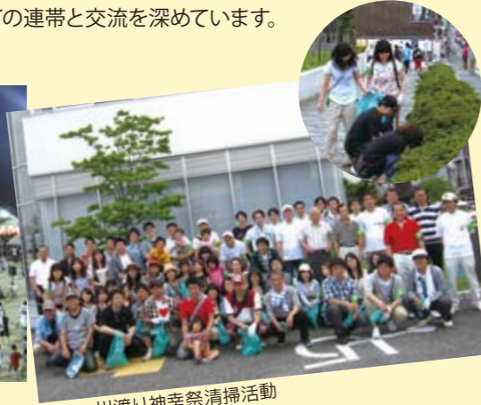
川渡り神幸祭清掃活動