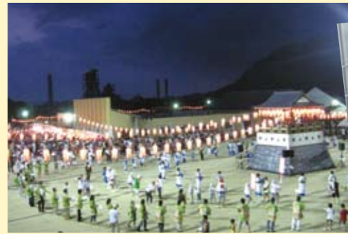
ふる里かわら夏まつり

創業以来常に皆様と共に、地域の暮らしに根ざした身近な金融機関として実績を重ねてまいりました。私たちしんきんでは、常にふれあいを大切にして、お付き合いの和を広げていきたいと願います。毎年盛大に開催される「川渡り神幸祭」への積極的な取り組みを始め、「ふる里かわら夏まつり盆踊り大会」、「I LOVE フクチフェスタ」、「福岡県立大学秋興祭」など様々な地域行事への参加などを通して、地域の一員としての連帯と交流を深めています。