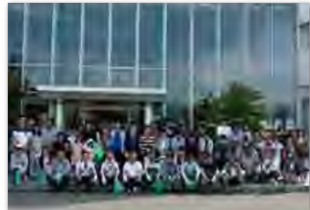
川渡り神幸祭清掃活動

創業以来常に皆様と共に、地域の暮らしに根ざした身近な金融機関として実績を重ねてまいりました私たちしんきんでは、常にふれあいを大切にして、お付き合いの和を広げていきたいと願います。毎年盛大に開催される「川渡り神幸祭」への積極的な取り組みを始め、「ふる里かわら夏まつり盆踊り大会」、「I LOVE フクチフェスタ」など様々な地域行事への参加などを通して、地域の一員としての連帯と交流を深めています。