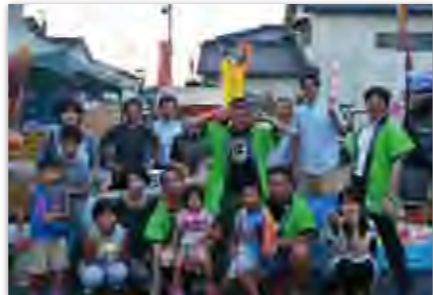
I LOVE フクチフェスタ